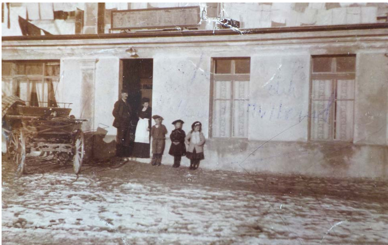
Le café à l'aube du XXe siècle. Serait l'un des frères Bornand avec son épouse et ses enfants. Plutôt l'un de ses successeurs ? Le café a été construit en ravancement de la maison d'origine. Cette sorte d'annexe sera démontée par Charles Rochat boucher lors de la reconstruction de la bâtisse dans les années trente.