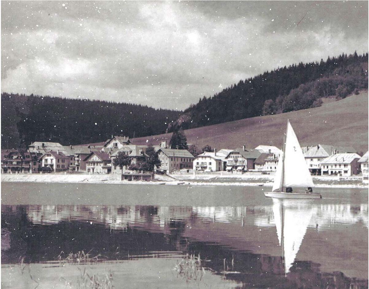
Sur cette photo, années trente, le café du Tilleul a été entièrement restauré, voire démolì pour faire place à la boucherie Rochat . Le tilleul a été coupé.