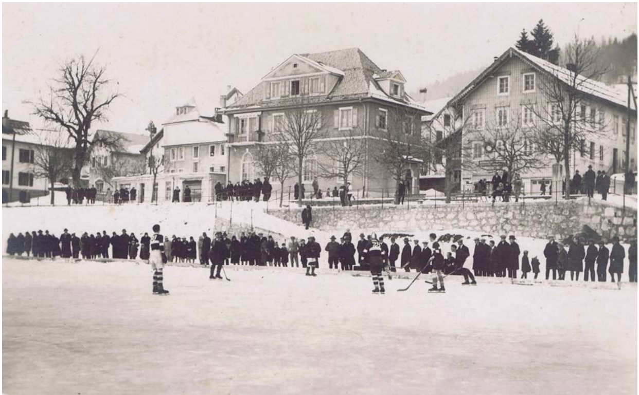
Photo vers 1930 environ. Le tilleul est toujours présent, avec à son arrière les étranges ravancements de ce qui était il n'y a pas longtemps encore le Café du Tilleul. C'est sans doute peu après que la maison fut rachetée et transformée par Charles Rochat boucher. Le tilleul est toujours là.

Enquête. En quelle année fut abattu le gros tilleul du milieu du village ?